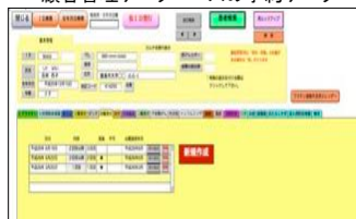
顧客管理データベースの予約データ

顧客管理データベース 1) 予防接種の予約は、当院独自で開発した顧客管理データベースに入力し、管理を行っています。