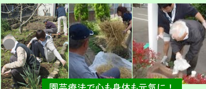
園芸療法で心も身体も元気に！