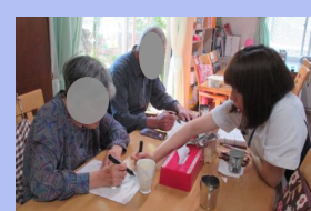
作業療法士による 個別機能訓練